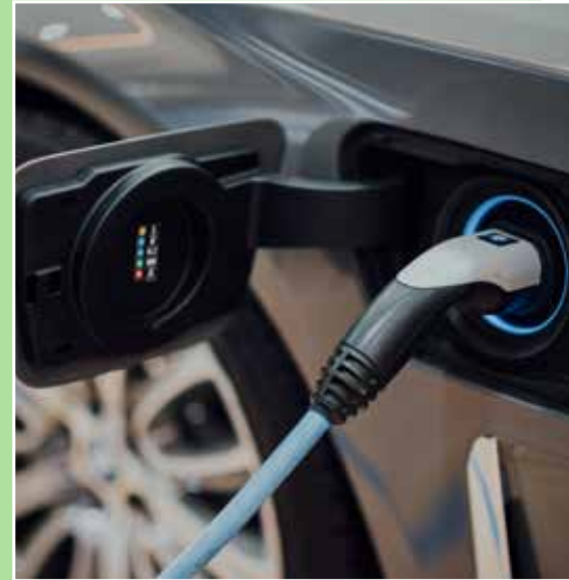
↑ Bis zum 31. Dezember kann die Kfz-Versicherung noch gewechselt werden

„Gedanken machen sollte man sich auch über die Absicherung des Fahrers. Wird dieser bei einem selbst verschuldeten Unfall verletzt, greift nicht die Kfz-Haftpflichtversicherung. Diese Sicherheitslücke kann jedoch mit einer Fahrerschutzversiche-