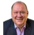
Redaktion Dirk Vollenkemper