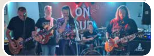
↑ Rockband On Our Knees

Erstmals wird es auch eine Hütte des Vereins Brauchtum und Weihnachtstraditionen e.V. geben. Hier wird eine heiße Suppe, Glühwein und Kinderpunsch verkauft. Der Erlös geht vollständig in die Vereinskasse und wird zur Erhaltung und zum Ausbau des Weihnachtsmarktes genutzt.