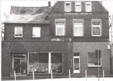
↑Bild 3: Am Schaufenster von Wibbeke-Richter haben wir uns die Nase plattgedrückt

gab es leckeres Mittagessen und zum Kaffeetrinken selbstgemachte Plätzchen und Stollen. Abends wurden im Backofen Bratäpfel gebacken und für die Erwachsenen gab es Punsch und Glühwein.