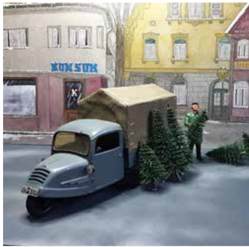
↑Bild 2: Mein Modell zeigt Bernhard Knepper als Tannenbaumverkäufer mit seinem Goliath-Dreirad auf dem Marktplatz vor einem von mir gemalten Bild