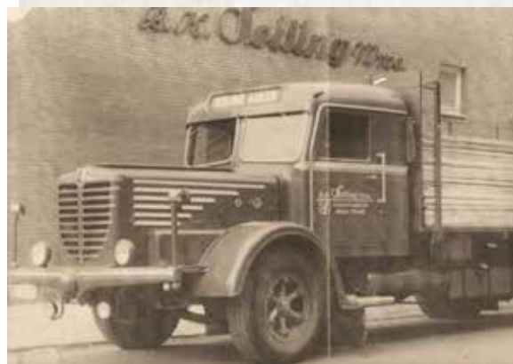
↑Der alte Büssing mit der großen Fahrerkabine

zu bauen. Im Verlauf der kommenden ca. vierzig Jahren habe ich über 90 Modelle nach Drensteinfurter Vorbildern in Eigenbauweise gebaut. Vor ca. zwanzig Jahren habe ich damit begonnen, Bilder aus meiner Kinder- und Jugendzeit zu sammeln. Tausende Bilder erhielt ich von Drensteinfurter Bürgern und Familien. Auf Veranstaltungen zeige ich auf Stellwänden und einer Leinwand viele Bilder aus meiner Sammlung. Besonders gerne halte ich Bildervorträge im Malteserstift, Tagespflagestellen und bei Klassentreffen. In unregelmäßigen Abständen schreibe ich Artikel mit meinen Kindheitserinnerungen, immer in Verbindung mit einem meiner Modelle. Seit 1959 bin ich Mitglied der DJK Olympia. 34 Jahre habe ich Handball gespielt, in diesen Jahren war ich 24 Jahre Handballabteilungsleiter, Jugendtrainer und Schiedsrichter. Bei schönem Wetter fahre ich gerne mit meinem NSU-Motorrad aus dem Jahr 1949 durch die Bauerschaften rund um Drensteinfurt. Das ist für mich jedes Mal eine Zeitreise.