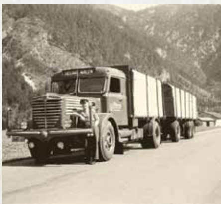
↑Seiling's Büssing auf den Straßen Österreichs