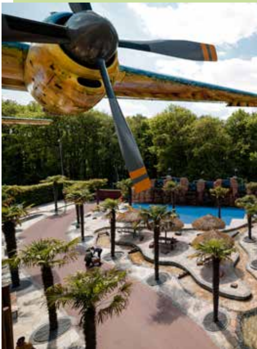
↑ Bauernhof Erlebnis XXL

Im nördlichen Ruhrgebiet befindet sich mit dem Ketteler Hof in Haltern am See ein weiteres Ausflugsziel für Familien. Der Ketteler Hof ist ein Freizeitpark im Familienbetrieb, der ohne klassische Fahrgeschäfte auf das Mit-Mach-Erlebnis setzt. Durch Attraktionen wie Kletteranlagen,