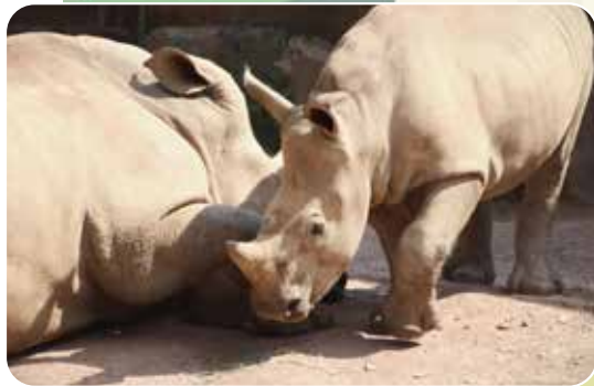
↑ Breitmaulnashorn Lisbeth (rechts) ist ganz schön groß geworden.

Im Zoo Osnabrück ist jeder Tag ein Erlebnis. Egal, ob man sich von den schillernden Fischen im Tetra-Aquarium verzaubern lässt, dem ulkigen Grunzen der Seelöwen nach Mariasiel folgt oder Nashorn-Kind Lisbeth beim Spielen zuschaut – hinter jeder Ecke wartet etwas Neues darauf, von großen und kleinen Abenteurern entdeckt zu werden.