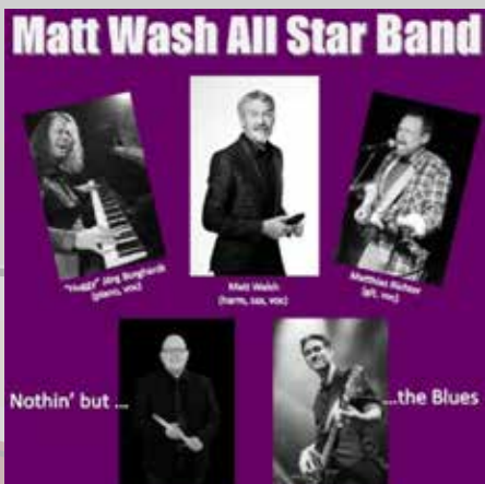
↑ MATT WALSH ALL STAR BAND

Ein weiteres rockiges Zeichen setzten dann die ZWILLINGE UND BLECHGÄNG. Die fünf Vollblutmusiker werden aus ihrem verbeulten Bandbus die Bühne stürmen. Mit ihren deutschen Texten, die man versteht, werden sie ein musikalisches Ausrufezeichen setzen. Ganz oft sind es Lieder über die Liebe und das Leben.