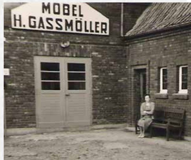
↑ Der Hof der Schreinerei Gaßmüller im Jahr 1958