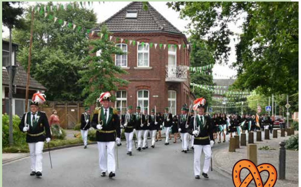
↑Festumzug durch das Wersedorf.

„Wir freuen uns auf tolle Tage und über viele neue Mitglieder“