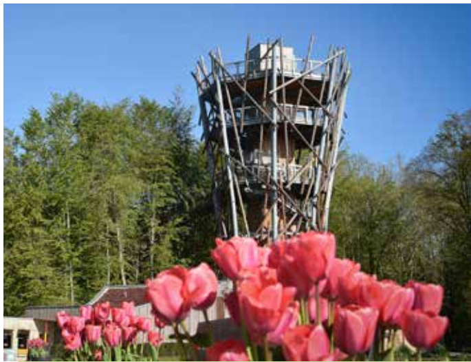
↑ Baumwipfelpfad Bad Iburg

Rutschen, Tretfahrzeuge, Trampoline, viel Grün und ein Wildgehege. Auf über 50 Rutschen im Park sind Geschwindigkeit, Nervenkitzel und Riesenspaß garantiert. Erleben Sie Tiere aus nächster Nähe. Auf dem Hof leben verschiedene Tiere, die beobachtet und erlebt werden können.