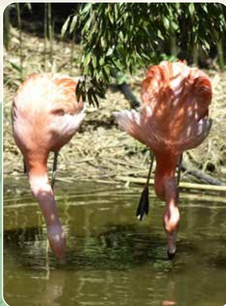
↑ Die rosafarbenen Flamingos hören Zoobesucher oft schon von weitem.

Gewinne eine Familienkarte für den Zoo Osnabrück (2 Erwachsene und 2 Kinder) im Wert von 101 Euro. (Weitere Infos auf der Gewinnspielseite)