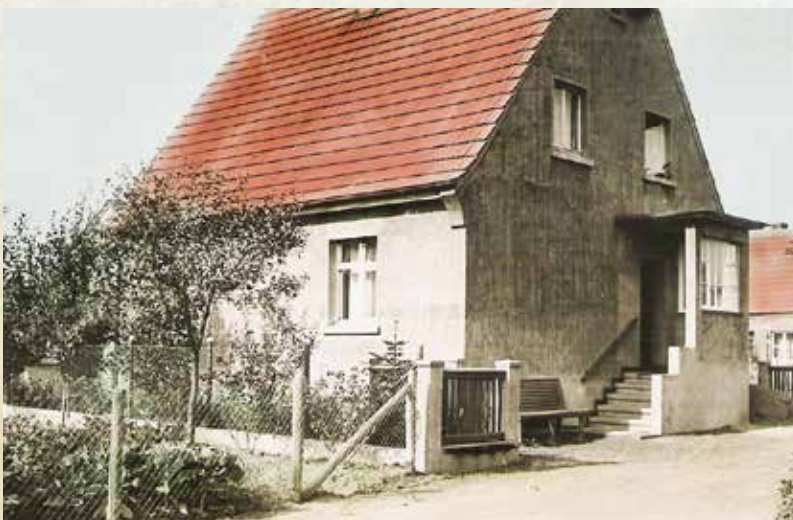
↑ Mein Elternhaus im Jahr 1958