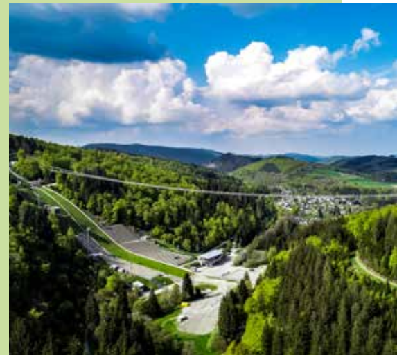
↑ Skywalk Willingen

de Landschaft des Uplands – während Sie 100 Meter über dem Strycktal schweben. Aus ganz neuer Perspektive ist die berühmte Mühlenkopfschanze zu erkennen. Beim Näherkommen werden die Details deutlich: Adlerhorst, Anlaufspur, Schanzenteller und Zuschauerränge.