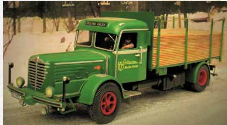
↑ Mein Modell des Büssing vor Gaßmüller`s Schreinerei

mein Modell und sagte: „Den habe ich gefahren“. Ja, ja, dachte ich, denn solche Aussagen höre ich oft auf meinen Ausstellungen. Die Besucher meinen meistens damit, dass sie früher so einen LKW-Typ gefahren haben. Der besagte ältere Herr aber holte aus seiner Brieftasche ein Foto, das ihn tatsächlich während einer Fahrpause mit „meinem“ voll mit Holz beladenen Büssing in Österreich zeigt (Bild 5). Für mich war das eine berührende Begegnung.