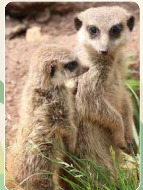
↑ Früh übt sich: Das junge Erdmännchen lernt, wie es am besten Ausschau nach Feinden hält.

Die Entscheidung fällt auf Samburu. Von der Samburu-Lodge aus ist die Sicht auf die Giraf-