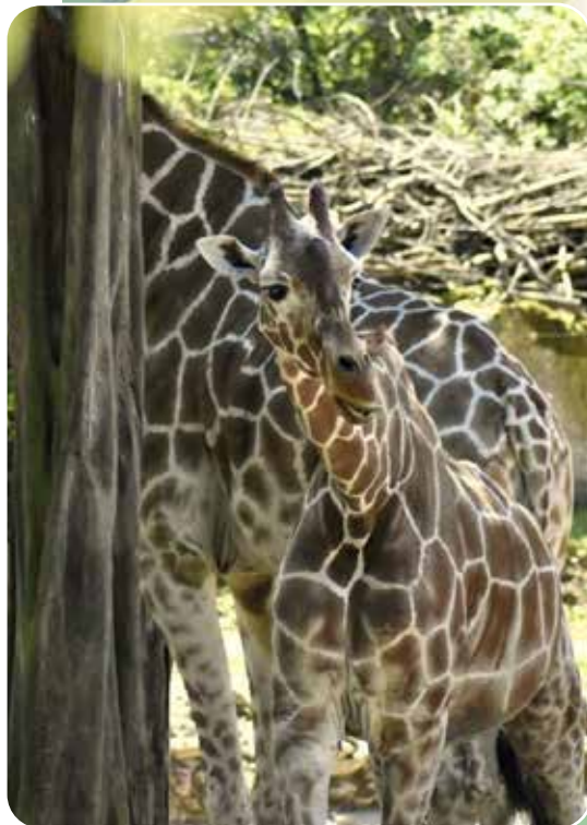
↑ Die vier Giraffenkühe des Osnabrücker Zoos lassen sich besonders gut von der Samburu-Lodge aus beobachten.

Wer schon einmal den Zoo Osnabrück besucht hat, weiß, dass direkt hinter dem Eingang ein Highlight wartet: die Chile- und Kubaflamingos begrüßen die Besucher am Eingang mit ihrem Geschnatter. Es macht immer wieder Spaß die Gleichgewichtskünstler dabei zu beobachten, wie sie seelenruhig auf einem Bein stehen und dabei sogar trinken können. Doch von hier aus geht es erst richtig los – und zwar im Dunkeln. Im Unterirdischen Zoo sind unter anderem Nacktmulle und Spitzmaus-Langzüngler-Fledermäuse zuhause. Bei den Fledermäusen ist immer viel los. Denn für die nachtaktiven Tiere wird im Zoo der Tag zur Nacht: Dafür wird ihre Höhle tagsüber mit schummerigem, blauen Licht ausgeleuchtet, das Mondlicht simuliert. Nach dem Ausflug ins Erdreich