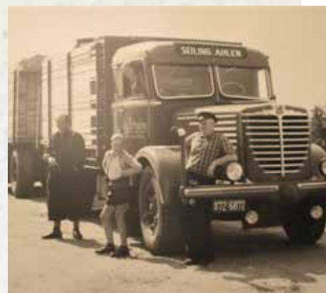
↑Die Urlaubsfahrt mit Familie nach Österreich