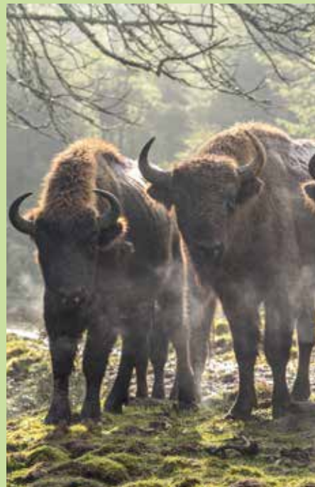
↑ Wisent-Welt Wittgenstein