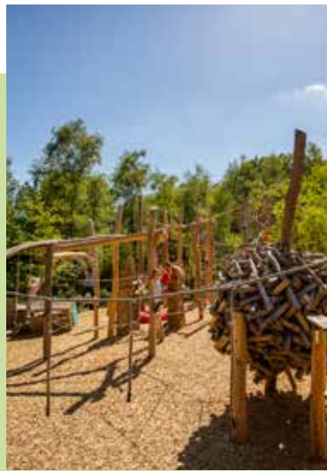
↑ Ketteler Hof in Haltern am See

Der Baumwipfelpfad Bad Iburg bietet mit fast 600 Metern Gesamtlänge neue und spannende Ausblicke auf den Waldkurpark und das Iburger Schloss. Auf dem Baumkronenpfad entdecken Besucherinnen und Besucher jeden Alters an den über 30 interaktiven Erlebnis- und Lernstationen attraktiv verpacktes Wissen mit zahlreichen Details zu Flora, Fauna, Geologie und Erdgeschichte. Jeder und jede erleben einen Spaziergang durch die Wipfel und diese einmaligen Waldpersönlichkeit natürlich anders. Wer beispielsweise noch nicht wusste, dass die Altbäume im Waldkurpark allein mit ihren Höhlen Lebensraum für fünf verschiedene Fledermaus-