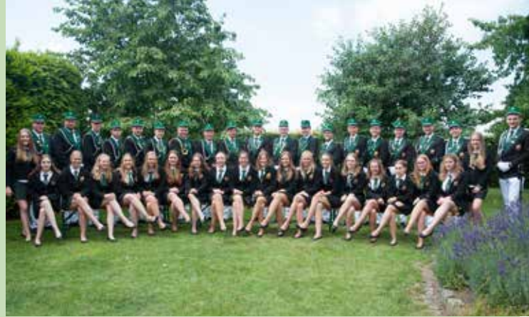
↑Fahngarde und Ehrengarde

Mit einem großen Jubiläumstag startet in diesem Jahr das Schützenfest des Albersloher Schützenvereins 1885 e.V. Die Ehrengarde besteht nunmehr 70 Jahre und die Fahngarde bringt es nach Neugründung mittlerweile auch schon auf 20 Jahre. Beide Abteilungen der Albersloher Schützen sorgen seit vielen Jahrzehnten für reichlich Geselligkeit und dies nicht nur im Vereinsleben. Die Ehrengarde beeindruckt jedes Jahr aufs Neue mit ihren Auftritten. Die Garde ist geprägt durch die junge Schützengeneration und ist bei den offiziellen Anlässen auf dem Schützenfest oder auch sonst im Vereinsjahr immer stets diszipliniert zur Stelle. Aber auch bei ihnen darf der Spaß natürlich nicht zu kurz kommen und so sorgen sie immer wieder für gute Stimmung auf dem Schützenfest