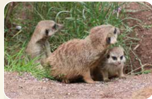
↑ Der Erdmännchen-Nachwuchs ist zur Zeit der Hingucker in der Tierwelt Takamanda.

Gewinne eine Familienkarte für den Zoo Osnabrück (2 Erwachsene und 2 Kinder) im Wert von 101 Euro. (Weitere Infos auf der Gewinnspielseite)